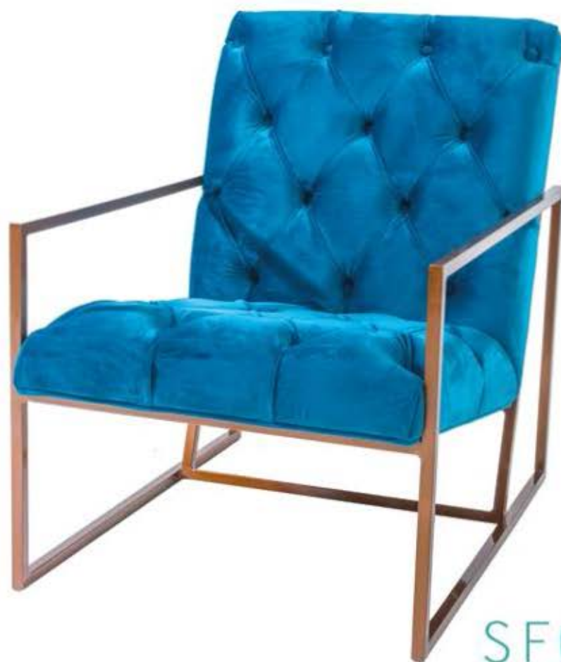
SF04 - 01