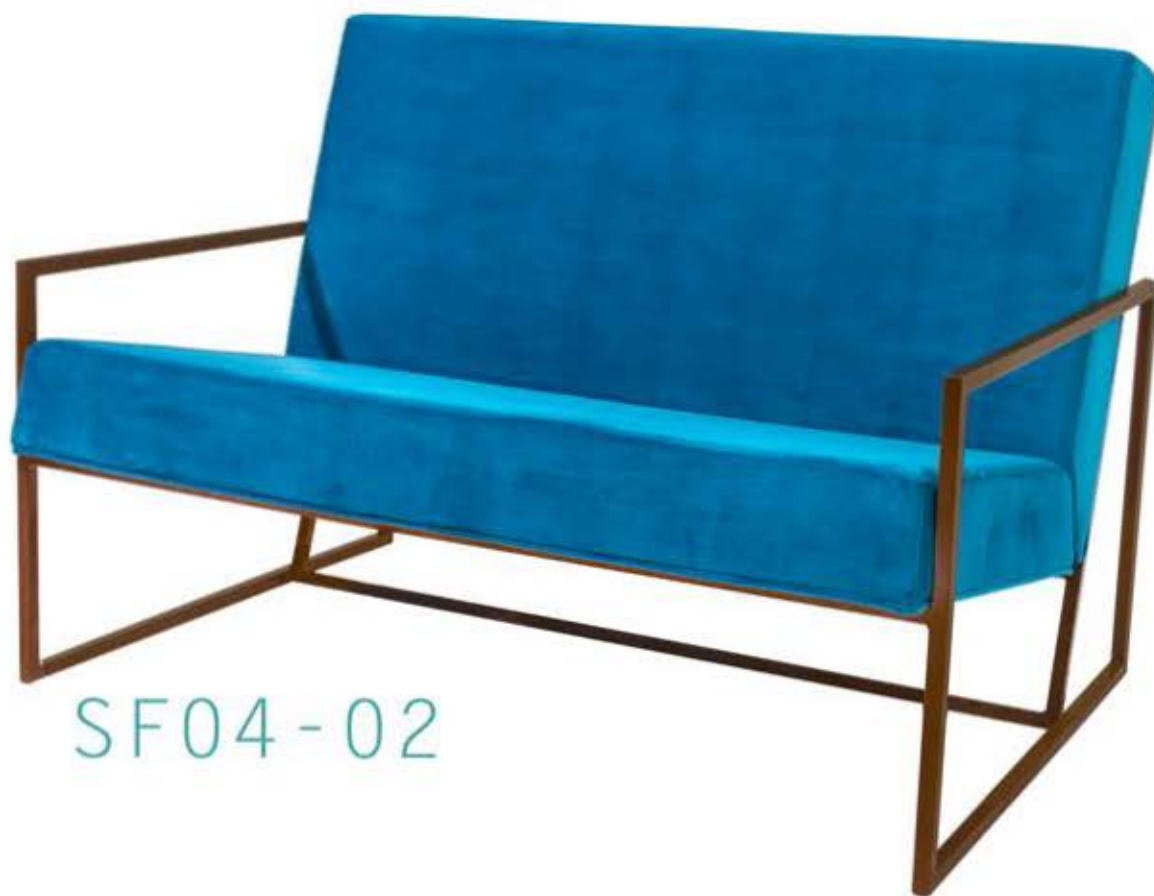
SF04 - 02